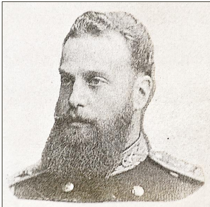
Великий Князь Алексей Александрович Романов, сын императора Александра II